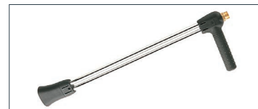
3.8007.LCPR89117 (170/21) 3.8007.LCPR40160 (200/21)